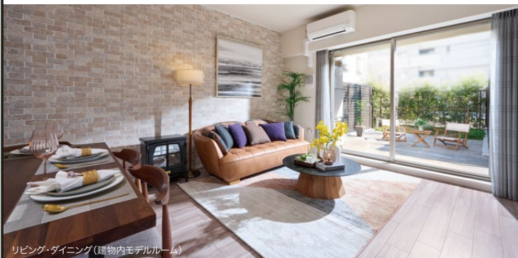
リビング・ダイニング(建物内モデルルーム)