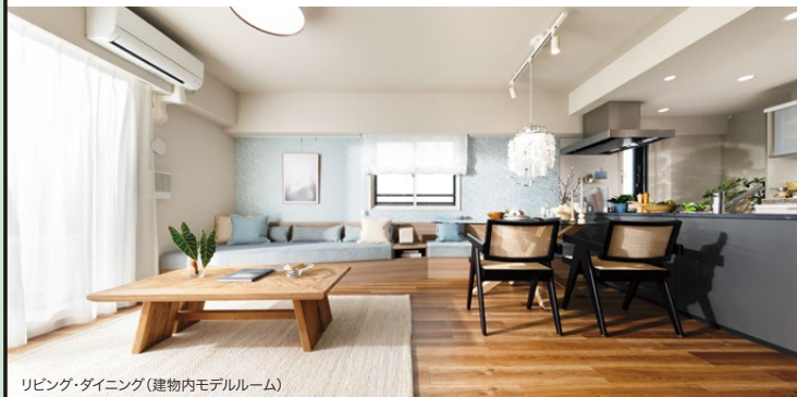
リビング・ダイニング(建物内モデルルーム)