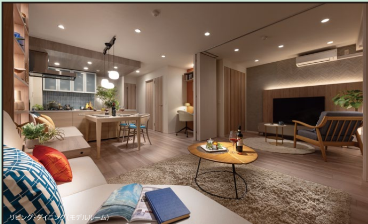
リビング・ダイニング(モデルルーム)