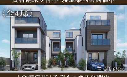
[全棟完成] モデルハウス公開中