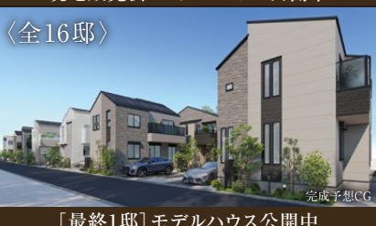
[最終1邸] モデルハウス公開中