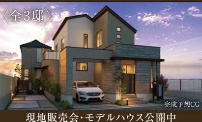
現地販売会・モデルハウス公開中