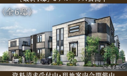
資料請求受付中・現地案内会開催中