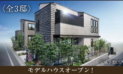
モデルハウスオープン!