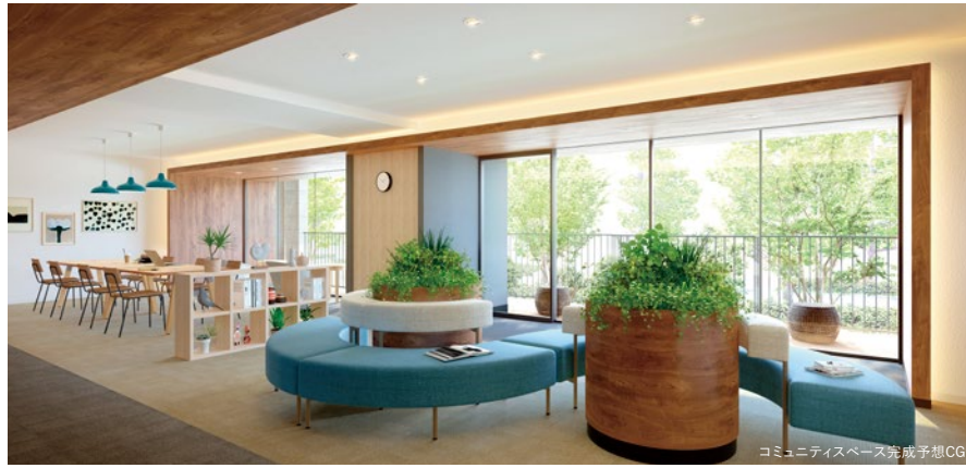
コミュニティスペース完成予想CG

※コミュニティスペース完成予想CGは、図面を基に描き起こしたものであり、実際とは異なる場合があります。また植栽につきましては特定の季節・ご入居時の状態を想定して描かれたものではありません。また外観の設備機器につきましては、表現上省略しております。 ※1:掲載の花火のイメージ写真は、あくまでイメージであり、見え方については実際とは異なります。