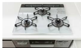
ガラストップ/Siセンサーコンロ

■第3期1次販売予告概要●販売戸数/未定●予定販売価格/3,400万円台~5,400万円台(予定)※100万円単位●最高価格帯/4,400万円台(14戸)(予定)※100万円単位●間取り/3LDK・4LDK●住戸専有面積/65.95㎡~81.12㎡●バルコニー面積/12.00㎡~12.80㎡●テラス面積/16.9㎡・17.2㎡●管理費(月額)/11,500円~14,100円(予定)●管理準備金(入居時一括)/26,400円~32,500円(予定)●修繕積立金(月額)/6,600円~8,120円(予定)●修繕積立一時金(入居時一括)/429,000円~528,000円(予定)●本物件は第3期1次で販売する住戸が確定しておらず、販売戸数が未確定のため、物件データは販売済住戸を除く全販売住戸のものを表示しています。確定情報は、本広告にて明示いたします。●販売開始予定/2022年7月中旬※掲載の情報は2022年7月4日現在のものです。詳細は物件HPをご覧ください。