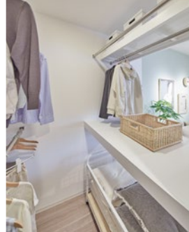
ファミリークローゼット