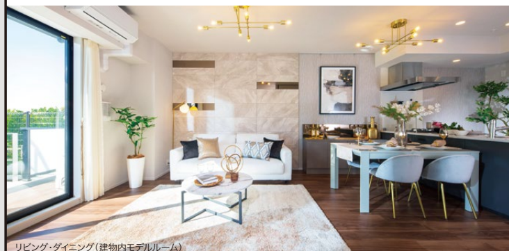
リビング・ダイニング(建物内モデルルーム)