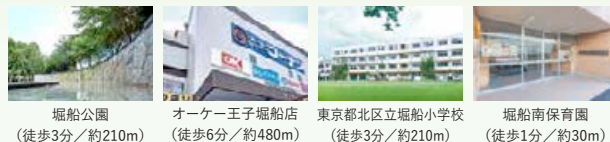
堀船公園 (徒歩3分/約210m) オーク王子堀船店 (徒歩6分/約480m) 東京都北区立堀船小学校 (徒歩3分/約210m) 堀船南保育園 (徒歩1分/約30m)