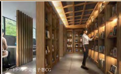
アートラウンジ完成予想CG