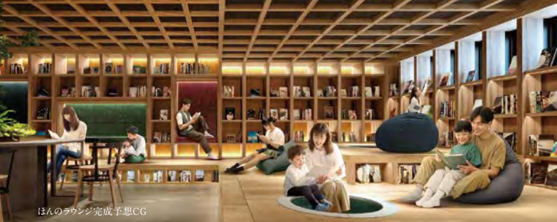
3人のラウンジ完成予想CG