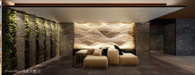
アートラウンジ完成予想CG