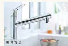
浄水器機能付シャワー水栓