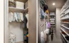
ウォークインクローゼット