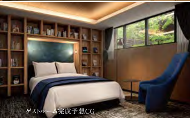
ゲストルーム完成予想CG