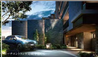
カーポート完成予想CG

2LDK～4LDK、全17タイプ。広々とした空間で、家族の便利で心地いい時間を。