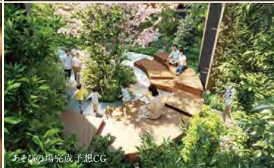
あそびの場完成予想CG