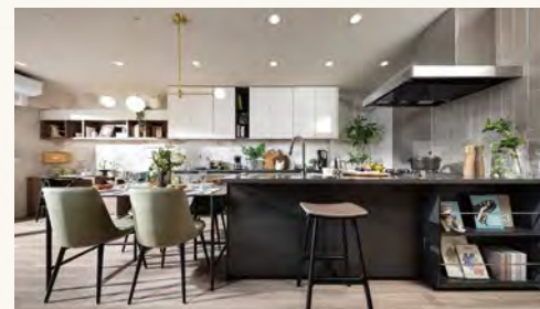
フルオープンキッチン