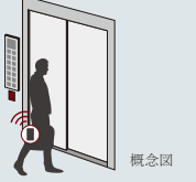
鍵をポケットに入れたまま 解錠できるテブラキー

「リビアーノガーデン茶屋ヶ坂」全体物件概要 ●名称/リビアーノガーデン茶屋ヶ坂●所在地/名古屋市千種区千代田橋一丁目101番1●交通/地下鉄名城線「茶屋ヶ坂」駅徒歩5分、市バス・名鉄バス「茶屋ヶ坂」停(基幹バス)徒歩8分●地域・地区/近隣商業・第一種住居地域●総戸数/146戸●敷地面積/5,114.12㎡(建築確認対象敷地面積5,114.11㎡)●建築面積/1,860.00㎡●延べ面積/11,268.29㎡●構造・規模/鉄筋コンクリート造 地上10階建●駐車場台数/134台(平面)地上10階建●駐車台数/134台(平面)●バイク置場/7台(月額使用料:2,000円)●管理形態/区分所有者全員で管理組合を結成し管理会社へ委託、管理員巡回方式●管理会社/株式会社長谷工コミュニティ●分譲後の権利形態/敷地:専有面積割合による所有権の共有、建物:専有部分は区分所有権、共用部分は専有面積割合による所有権の共有●竣工時期/2027年2月下旬予定●入居時期/2027年3月下旬予定●事業主(売主)/名鉄都市開発株式会社 TEL:052-581-1223 ●事業主(売主)/アイシン開発株式会社 TEL:0566-27-8700●事業主(売主)/販売提携(代理)/住友不動産株式会社 TEL:050-3112-5099●事業主(売主)/清水総合開発株式会社 TEL:03-6228-7430●販売提携(代理)/株式会社長谷工アーベスト東海支社 TEL:052-238-3725●設計・監理/長谷工コーポレーション 関西・東海エンジニアリング事業部●施工/株式会社長谷工コーポレーション【先着順受付概要】●販売戸数/12戸●販売価格(税込)/4,490万円～7,350万円●最高価格帯/5,000万円台(3戸)●間取り/2LDK+S(納戸)～4LDK●住戸専有面積/67.55㎡～85.54㎡●バルコニー面積/11.02㎡～13.30㎡●サービスバルコニー面積/5.61㎡●アルコーブ面積/2.16㎡～4.56㎡●インターネット使用料(月額)/858円●管理費(月額)/11,480円～14,540円●修繕積立金(月額)/8,110円～10,260円●修繕積立一時金(引渡し時一括払い)/676,000円～855,000円●管理準備金(引渡し時一括払い)/14,000円～17,000円●販売スケジュール/先着順受付中●申込受付場所/茶屋ヶ坂ガーデンマンションサロン●申込の際には印鑑及び最新2年分の収入証明、本人確認書類(運転免許証・パスポート等)が必要となります。●先着順申込受付につき、売却済みの場合がございます。予め、ご容赦下さい。●表示金額には消費税相当額が含まれております。●掲載の情報は2026年5月14日現在のものです。詳細は物件HPをご覧ください。