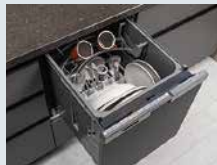
ビルトイン食器洗い 乾燥機を装備