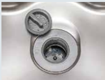
生ゴミを粉砕する ディスポージャー