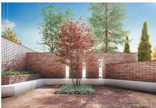
パティオ完成予想CG