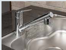
浄水器一体型シングル レバー式シャワー混合水栓