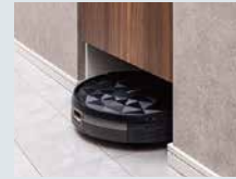
コンセントプラグを設置した 掃除ロボット収納