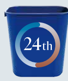
いつでもゴミ出せできる 24時間ゴミステーション