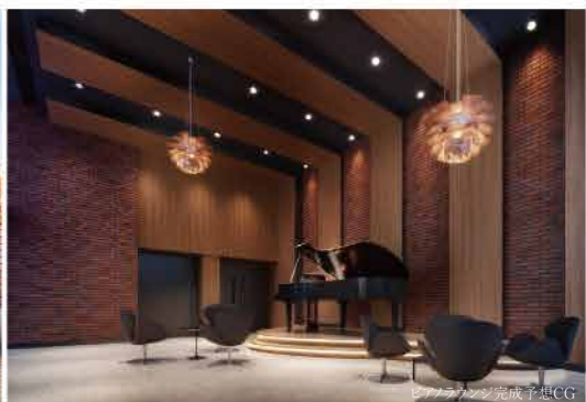
リビング完成予想CG

※掲載の外観完成予想CGは計画段階の図面を基に描き起こしたもので、実際とは異なります。また、変更となる場合がございます。雨樋、給気口、スリッパ等、一部再現されていない設備機器がございます。また、タイル・石貼等の大きさは実際とは異なります。植栽は計画段階のものであり、変更となる場合があります。また、入居時を想定して描かれたものではありません。葉の色合いや枝ぶり、樹形は想定であり、竣工時には完成予想CG程度には成長していません。※周囲の建物、電柱、架線、標識、ガードレール等につきましては一部省略または簡略化しております。※距離は現地から地図上の概測で、徒歩時間は80mを1分で算出し端数を切り上げたものです。