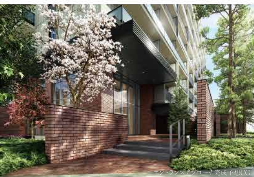
エントランスアプローチ完成予想CG