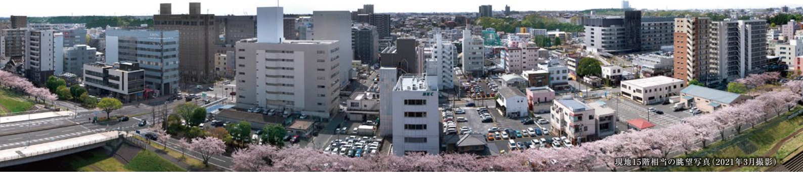
現地15階相当の眺望写真(2021年3月撮影)

※掲載の眺望写真は、計画地の高さ約42.5m(15階相当)より東～西を撮影した眺望写真(2021年3月撮影)にCG加工を施したもので実際とは異なります。眺望は階数・住戸により異なります。また、眺望・周辺環境は変わる可能性があり、将来に渡って保証されるものではありません。