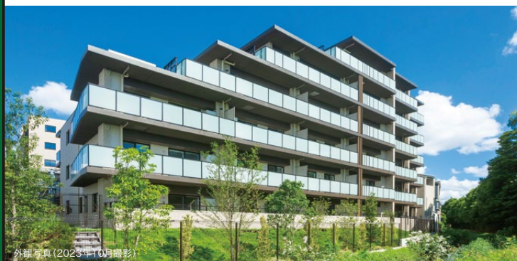
外観写真(2023年10月撮影)